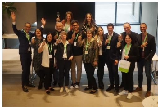
Groß ist die Freude nach diesem großartig erfolgreichen ersten Bundessymposium für Praxisanleitung in der GuK

Sollten Sie noch Fragen, Interesse an Ergebnissen der Parallelsessions oder auch an der Mitwirkung in der BAG-PAL haben, können Sie sich gerne an die Vorsitzenden oder an die einzelnen Mitglieder der jeweiligen Bundesländer der Bundes-ARGE Praxisanleitung wenden